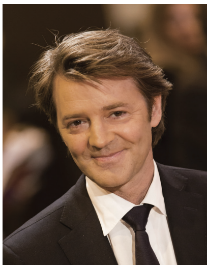
François BAROIN Président de l'AMF

Les communes et les intercommunalités sont engagées, comme le reste de la société, dans une profonde transformation numérique. En particulier, leurs échanges dématérialisés avec les citoyens, les acteurs économiques et les administrations publiques se sont multipliés. Dans le même temps, elles sont aussi devenues, ces derniers mois, des cibles d'attaques informatiques de plus en plus nombreuses.